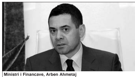
Ministri i Financave, Arben Ahmetaj

është një lloj incentive, ku nëse paguhet detyrimi principal, të hiqen interesat dhe gjambat, por për periudhën deri më 31 dhjetor 2014. Kjo është një metodologji e përdorur në Kosovë dhe është hera e fundit që përdoret,